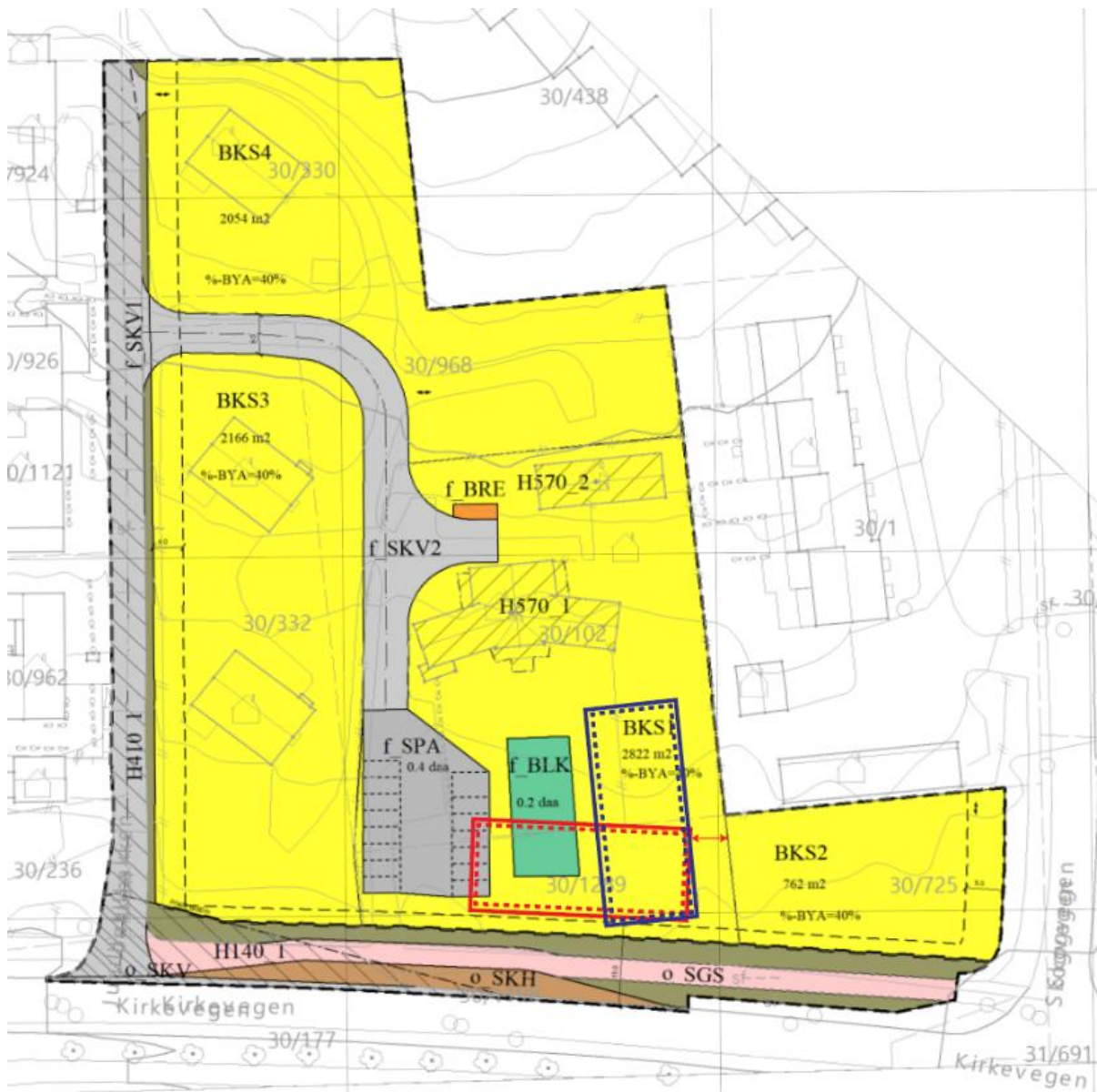
Figur 3: skisse for foreslått og alternativ plassering (rødt) av forsamlingslokalet.