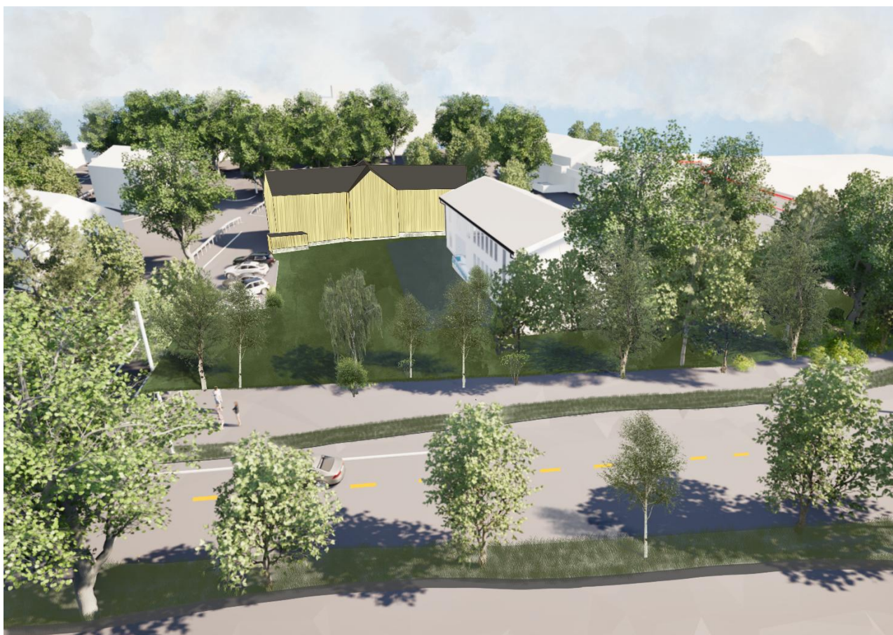
Figur 4: Illustrasjonen viser en foreløpig 3d-modellen av forsamlingslokalet i forhold til Heimen (gult)