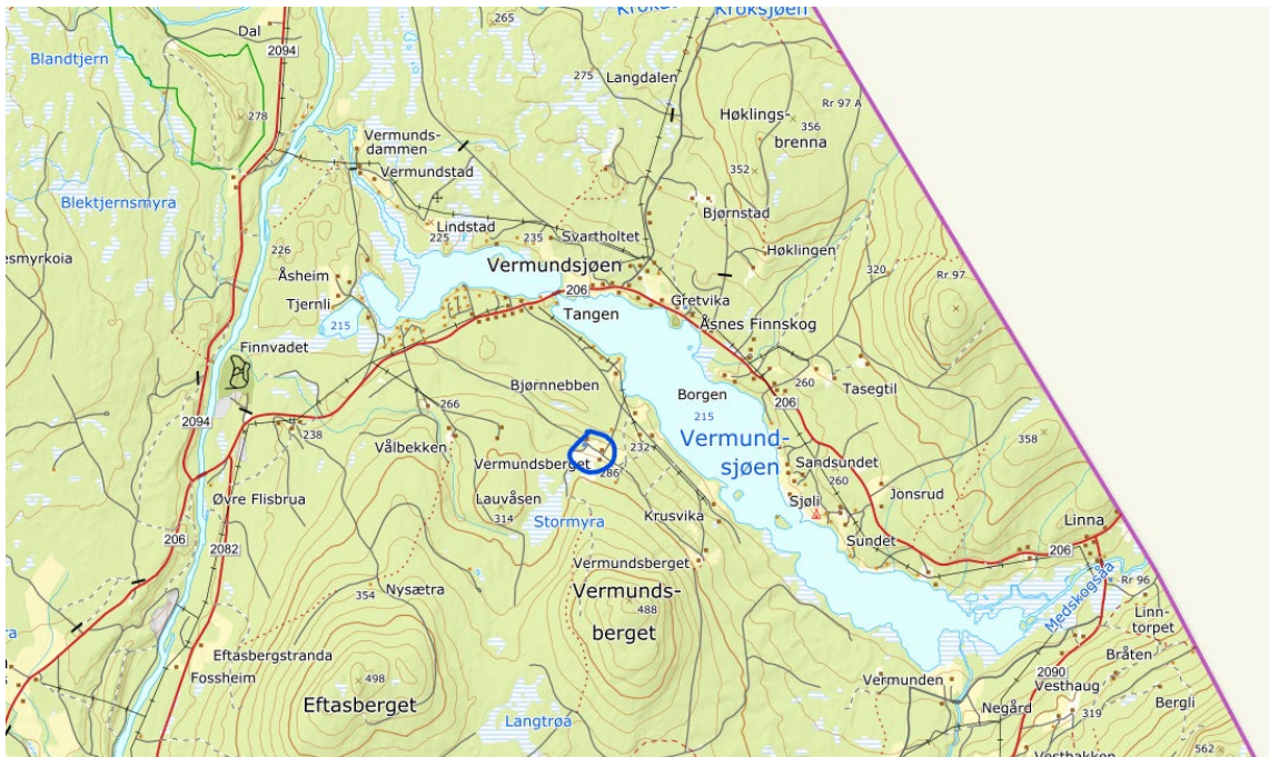
Figur 1: Kartutsnitt som viser planområdets plassering (blå sirkel) ved Vermundsjøen, Åsnes Finnskog. Kartutsnittet er hentet fra norgeskart.no.

Planområdet (Gnr/bnr 87/26 og 87/14) er på 140 daa og ligger på relativt flat grunn ved Vermundsjøen, i åssiden ved Vermundsberget, på Åsnes Finnskog. Området har adkomst via fylkesveg 206 og Basbakkvegen, som er en privat veg. Planområdet ligger cirka 27 km fra Flisa, kommunesenteret i Åsnes.